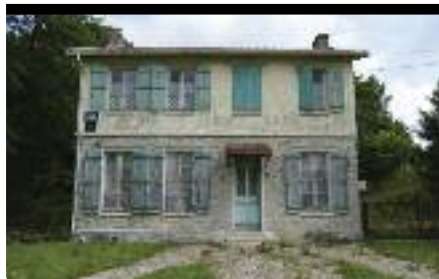
La maison construite à l'emplacement de la ferme Rimbaud, place Arthur Rimbaud. « Sur ces lieux, Rimbaud a espéré, désespéré et souffert. »