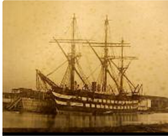
La frégate Danaë

Le 1 er septembre 1879, 110 communards, bénéficiaires de l'amnistie partielle du mois de mars,