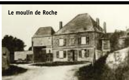
Le moulin de Roche